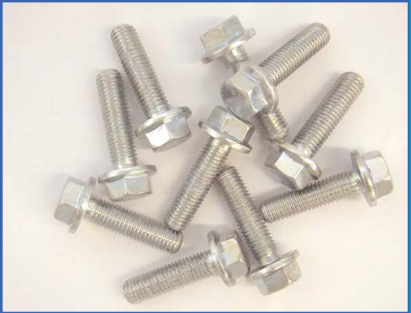
Sauer verzinkte Schrauben mit Proseal CF 200 nach 240 Stunden Salzsprühtest.