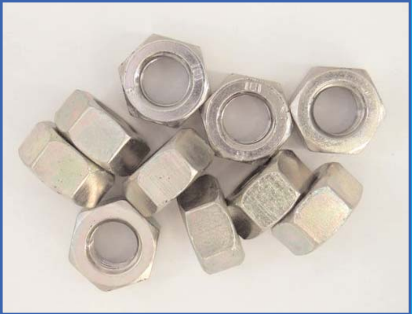
Verzinkte und mit Proseal CF 200 passivierte Muttern nach 240 Stunden Salzsprühtest.